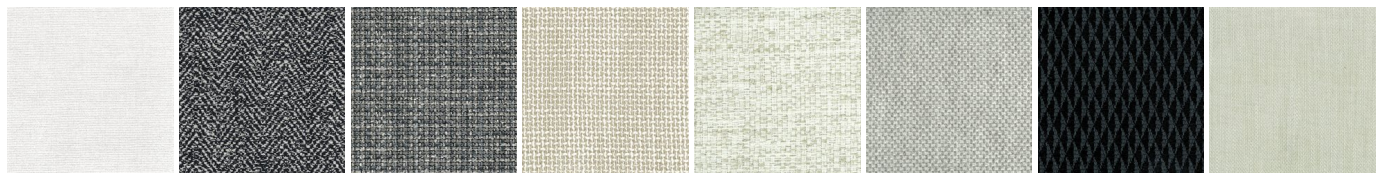
NAXOS - NEW