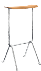
Frame: Galvanized Seat: Natural Leather L-0090