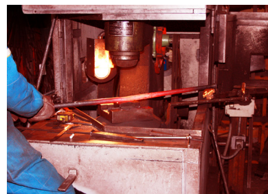
Processo di produzione