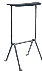
Frame: Black Seat: Black Leather L-0060