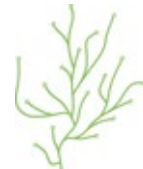
Algue, verde chiaro