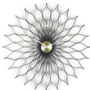
Sunflower Clock, frassino nero/ottone, Ø 750