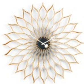
Sunflower Clock, betulla, Ø 750