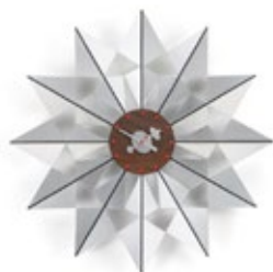
Flock of Butterflies, alluminio, Ø 610