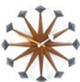
Polygon Clock, noce, Ø 430