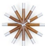
Wheel Clock, noce/alluminio, Ø 455