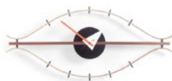
Eye Clock, ottone/noce, A 340 x L 760