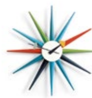
Sunburst Clock, multicolore, Ø 470