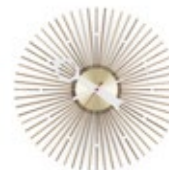
Popsicle Clock , Nussbaum, Ø 350