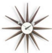
Sunburst Clock, noce, Ø 470