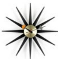
Sunburst Clock, nero/ottone, Ø 470