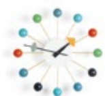
Ball Clock, multicolore, Ø 330