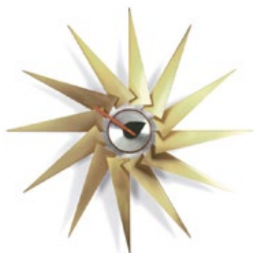
Turbine Clock, ottone/alluminio, Ø 765