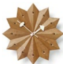
Fan Clock, Kirschbaum (USA), Ø 384