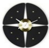
Petal Clock, nero/ottone, Ø 448