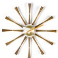
Spindle Clock, alluminio, legno noce, Ø 577