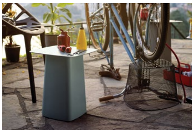
Metal Side Table (Outdoor)

Utilizzo all'esterno: adatti per l'uso all'esterno temporaneamente o su base stagionale. In caso di esposizione prolungata agli agenti atmosferici, pulire e riporre in un luogo riparato e asciutto per assicurare un utilizzo prolungato ed evitare un deterioramento dell'aspetto.