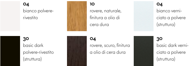
Piano del tavolo MDF